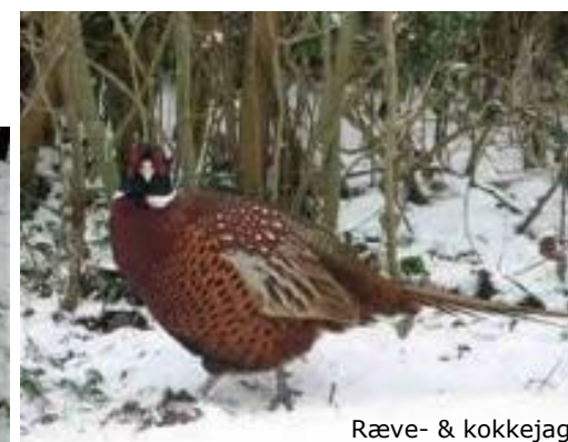
Ræve- & kokkejagt